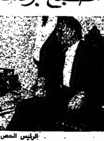
الرئيس الحص والقلمة يبايع الشوج (الاولى ونهار)